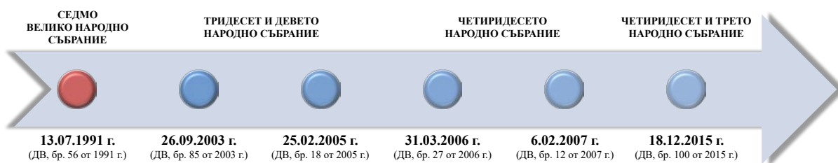
Фигура 2. Хронология на промените в КРБ